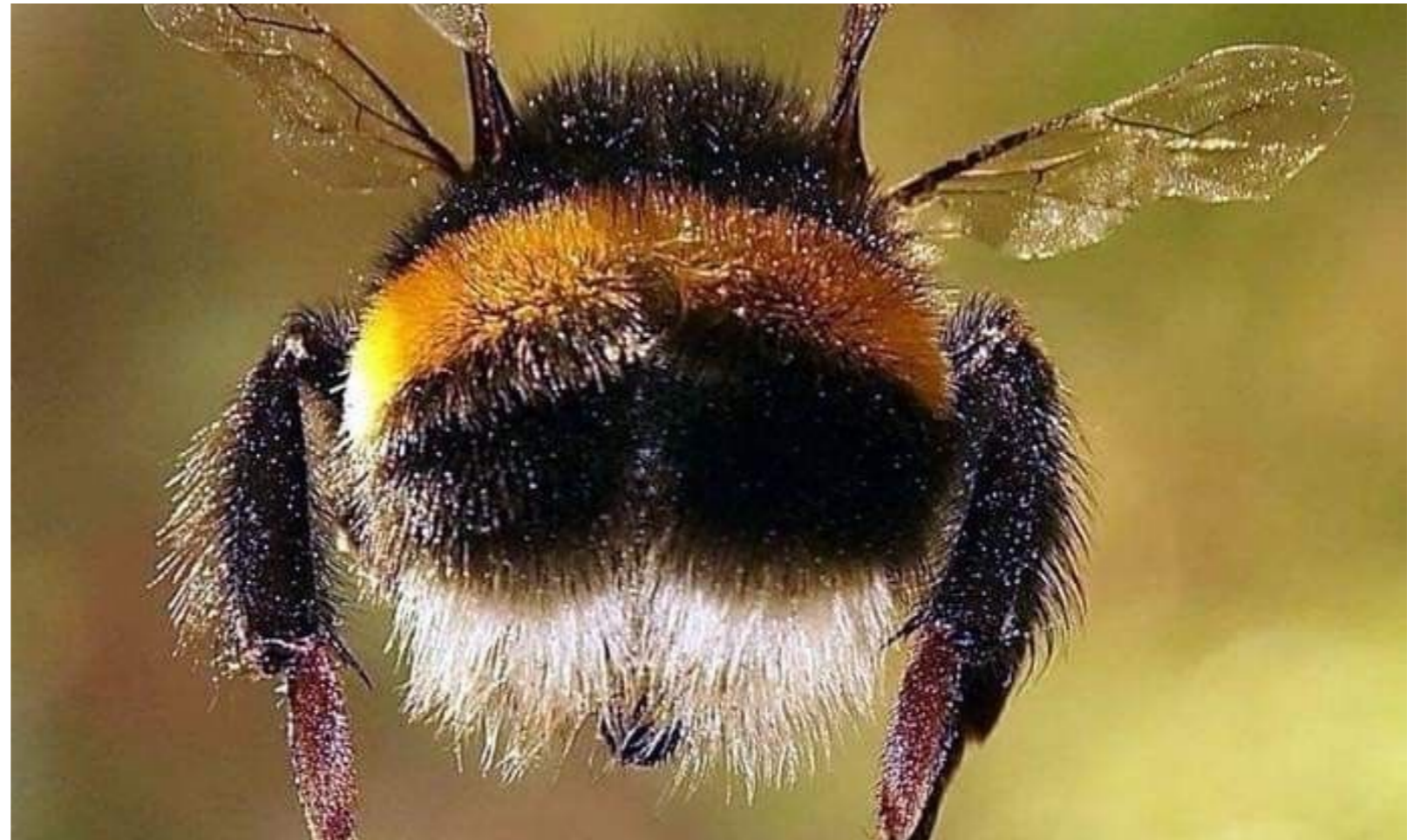
Abeille à miel

Prenons un exemple. Vous rêvez d'une abeille . Demandez-vous: « qu'est-ce qu'une abeille? » et répondez à la question comme si c'était un martien qui vous l'avait posée. Donnez votre explication (n'allez pas chercher dans une encyclopédie) mais expliquez